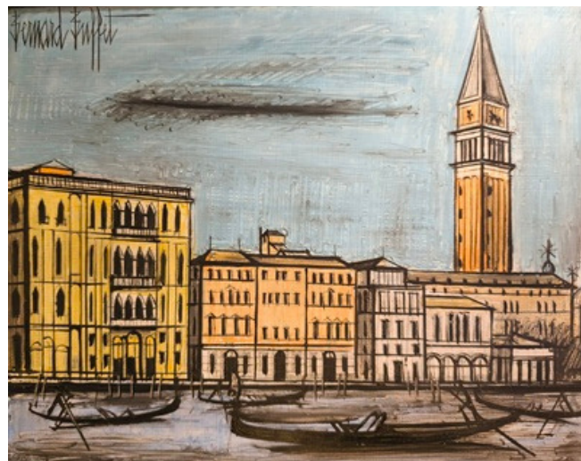
Bernard Buffet, Lagune et Campanile, huile, 33 x 41 cm