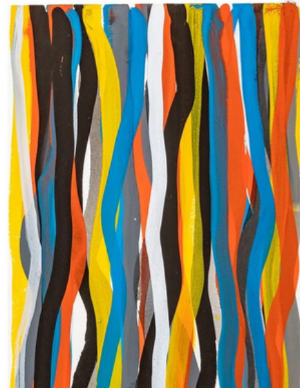
Sol LeWitt, Brushstrokes, 1995, gouache, © Marco Orlor Gallery