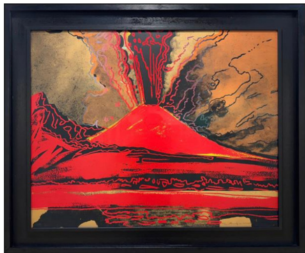
Andy Warhol, Vesuvius, sérigraphie, 1985 © Bernabò Home Gallery

Désormais, c'est au salon d'Antibes que de grandes galeries françaises et étrangères présentent les œuvres des grands artistes du XXe siècle et de l'art contemporain, mais aussi celles des créateurs du mobilier design ou vintage, et des métiers d'art. Le salon AAF ne cesse de surprendre avec la sélection chaque année de nouveaux exposants emblématiques des dernières tendances en matière de collection.