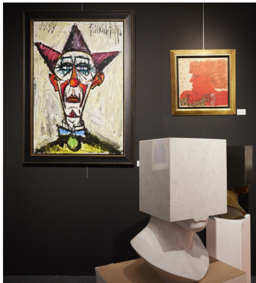
Stand Galerie Michel Estades (Antibes Art Fair 2025)