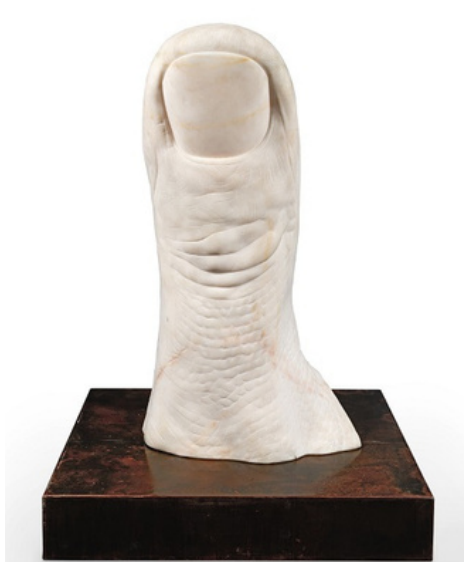
César, Pouce, marbre, pièce unique, 1983, 144x77 cm