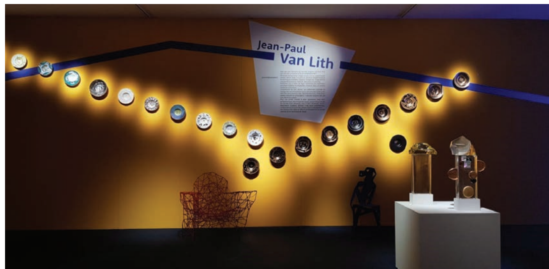
Antibes Art Fair 2023