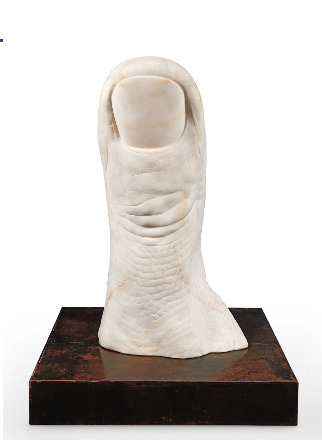
©César, Pouce, marbre blanc de carrare, pièce unique, 1983, 144x77x68 cm Galerie AD